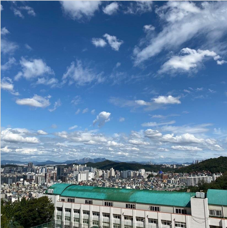
부천에서 가장 높은 정명고등학교^^